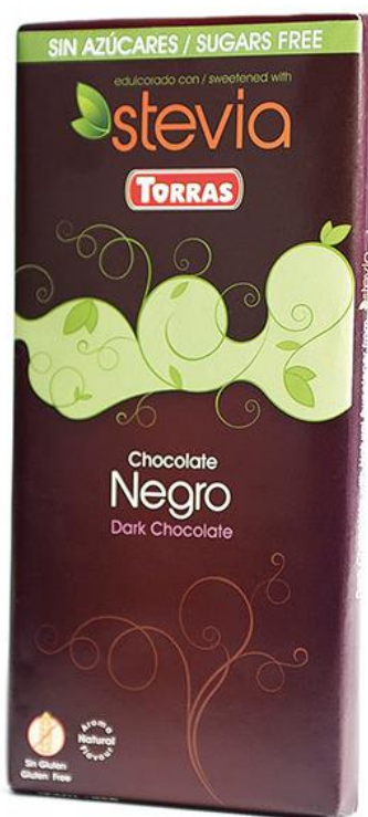
Rūgtā šokolāde 100g

Stēvija ir tropisks augs, no kura lapām tiek iegūts pilnīgi dabīgs saldinātājs. Pēdējā laikā tas kļuvis par ļoti populāru diabētisko produktu sastāvdaļu.