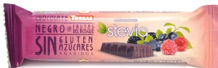
Šokolāde rūgtā ar meža ogām ar Stēvijās sald. b/cuk., b/glut. 35g