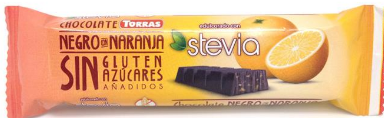
Šokolāde rūgtā ar apelsīnu gabaliņiem ar Stēvijās sald. b/cuk., b/glut. 35g