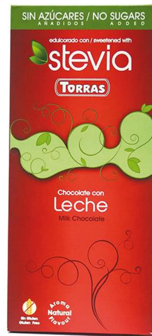
Piena šokolāde 100g