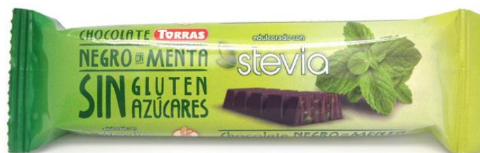
Šokolāde rūgtā ar piparmētru kraukšķiem ar Stēvijās sald. b/cuk., b/glut. 35g