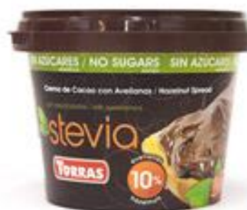
Kakao-lazdu riekstu krēms Torras ar Stēvijas saldinātāju 200g