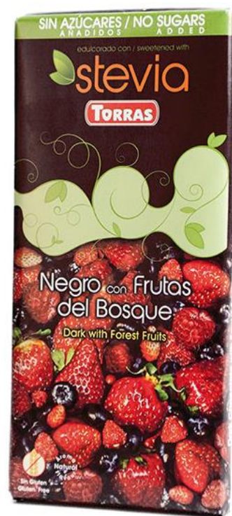
Rūgtā šokolāde 125g ar meža ogām