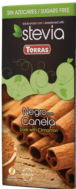
Šokolāde rūgtā ar kanēli un dabīgu Stēvijas saldinātāju Torras bez cukura 125g