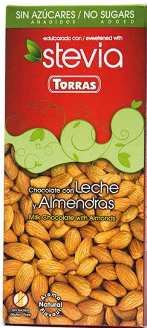
Piena šokolāde ar mandelēm 125g